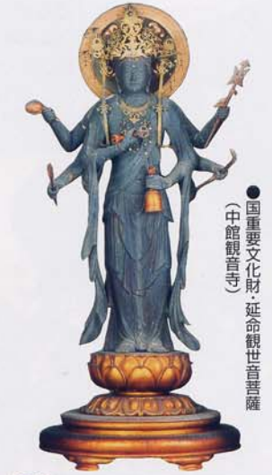
●国重要文化財 延命観世音菩薩 (中館観音寺)