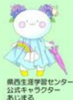
県西生涯学習センター 公式キャラクター あじまる