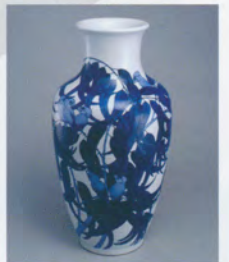
5代清水六兵衛 青華ゆかり花瓶 京都国立近代美術館蔵

陶芸界で初めて文化勲章を受章した、筑西市出身の板谷波山(1872-1963)と、5家の中で関わりがあった作家の作品も展示し、陶芸の近代化に尽力した作家たちの奮闘の軌跡も紹介します。