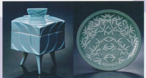
3代宮永東山 影青方形鑄文陶宮