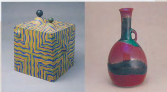
3代森野泰明 播-75-5 京都市立近代美術館蔵