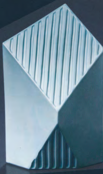
3代宮永東山 (1935- ) 「西方の塔」