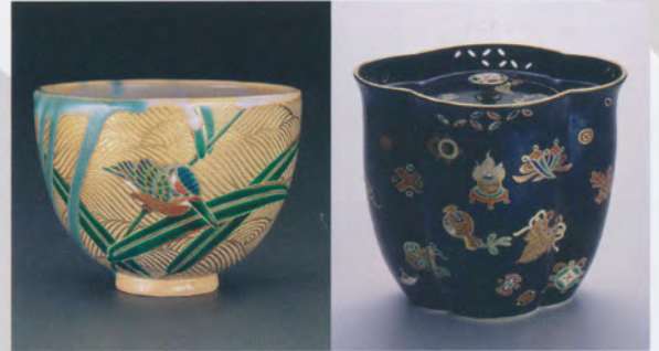
17代永樂善五郎 掛切芦ニ翡翠茶碗