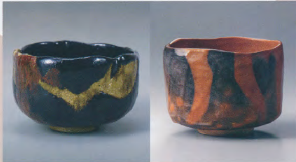
13代樂惺入 黒楽茶碗 銘 八千代 (公財)樂美術館蔵