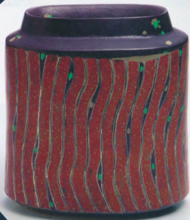
3代森野泰明(1934- ) 「赫錆條文緑彩花器」