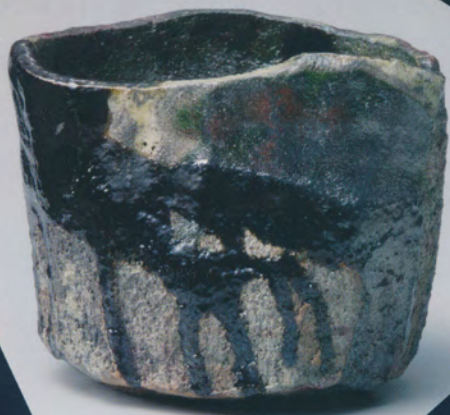
15代樂直入(1949- ) 「焼貫黒樂茶碗 銘 吹馬」