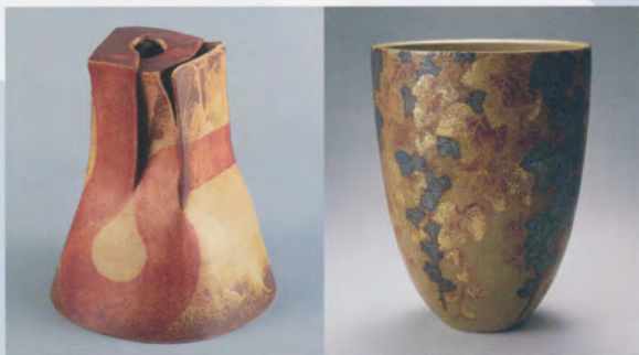
7代清水六兵衛 席花陶