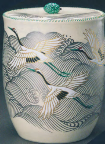
17代永樂善五郎(1944- ) 「波濤二鶴水指」