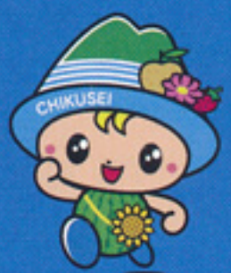
筑西市マスコットキャラクター 『ちっくん』