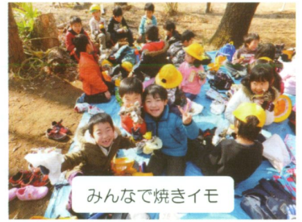
みんなで焼きイモ