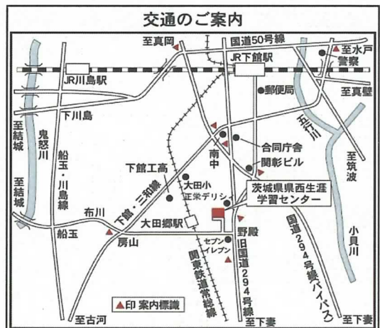
関東鉄道常総線大田郷駅徒歩8分 (案内板あり)

問い合わせ先 茨城県県西生涯学習センター 筑西市野殿 1371 番地(〒308-0843) 電 話 0296-24-1389(相談コーナー) FAX 0296-24-1450 http://www.kensei.gakusyu.ibk.ed.jp e-mail: info@kensei.gakusyu.ibk.ed.jp